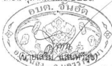
นายกองค์การบริหารส่วนตำบลจันอัด

ประกาศ ณ วันที่ ๑ เดือน ตุลาคม พ.ศ. ๒๕๖๑