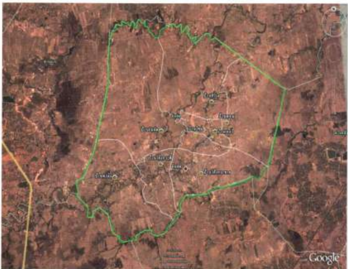
แผนที่องค์การบริหารส่วนตำบลจันอ็ด

ทิศใต้จรดกับตำบลโคกสูง และตำบลหนองไข่น้ำ อำเภอเมือง จังหวัดนครราชสีมา